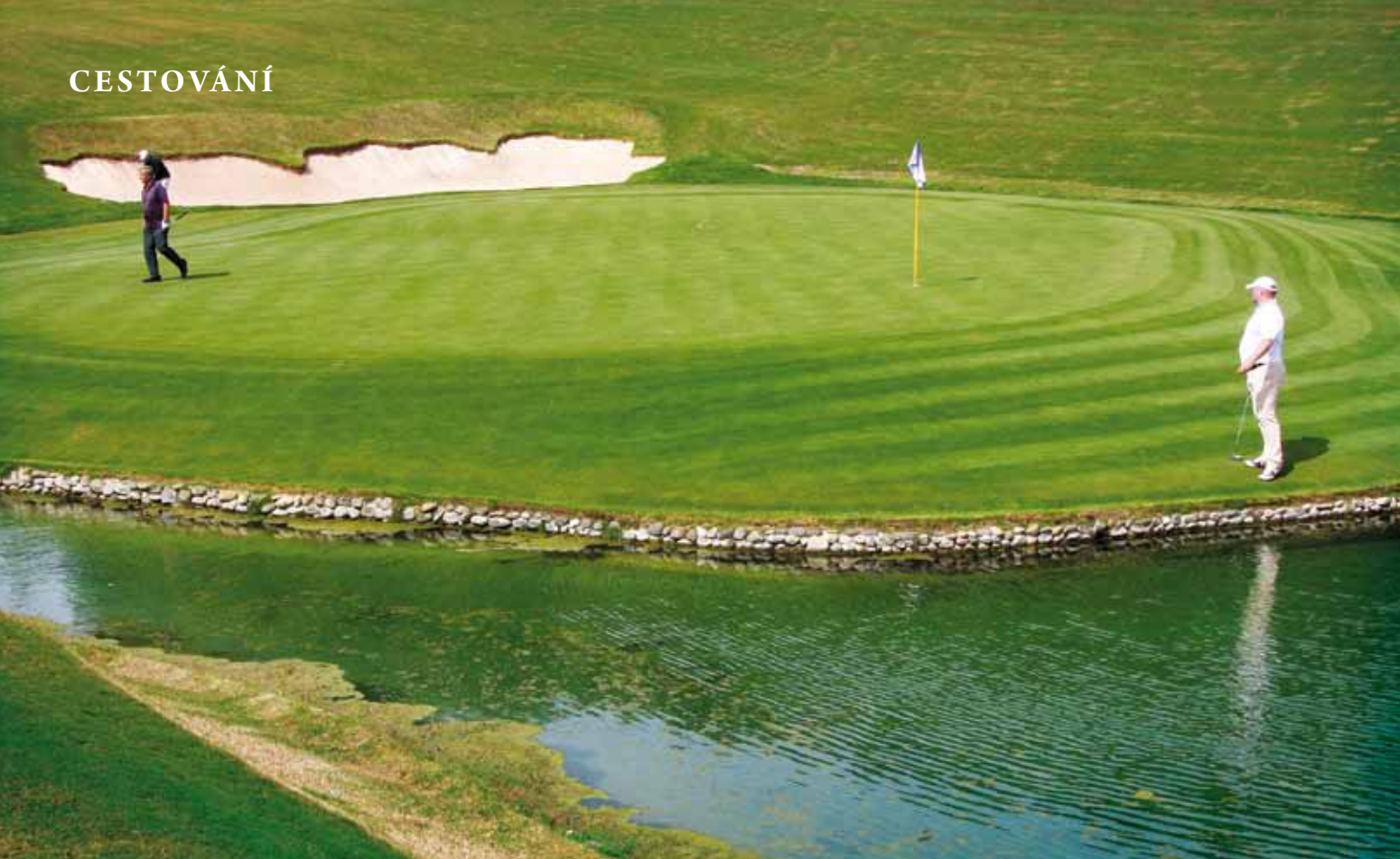
Pověstný 17. green, odkud míček snadno seběhne zpět do vody, kde ho vítají stovky jeho předchůdců

líp. Jsou i členové, již si zahrají jednou za rok nebo za dva..., ale být tu chtějí.