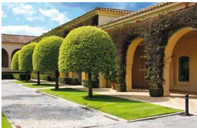
Klubovna je prostá, ale velmi úpravná

Architektem původního hřiště byl sloutný Robert Trent Jones Senior (jeho původní design pochází