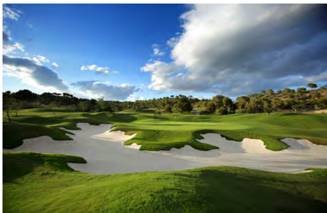
Popiska fotky popiska fotky

či promotér o celou cenu auta, protože případnou výhru pojistil. Pojistka nesmí být příliš drahá, ani příliš levná, aby byla rizika obou stran přiměřená. A přesně o výpočet její ceny se starají ti zmínění matematici. Berou přitom v potaz spoustu faktorů, od