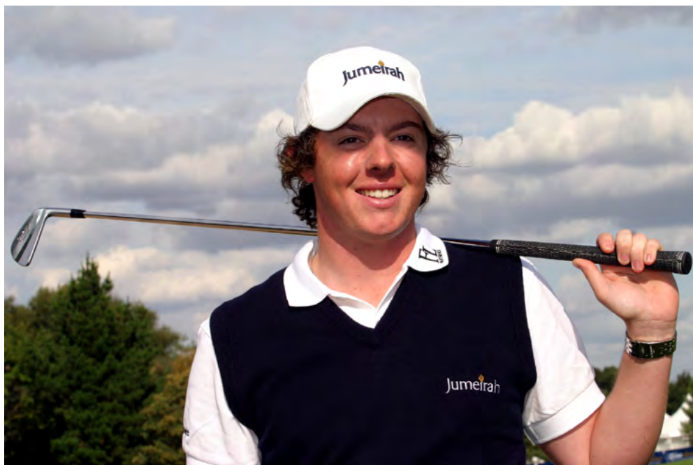
Popiska fotky popiska fotky

Určitě jste slyšeli spoustu historek na téma hole in one. Je to záležitost specifická, všemu ostatnímu ve hře se vymykající. Může ji zahrát mistr i nešikovný greenhorn, který vůbec neví, co dělá, rána může být úžasná nebo se zcela zkažený úder odrazí od skály daleko od fairwaye a dokouluje se z nepravděpodobného směru do jamky.