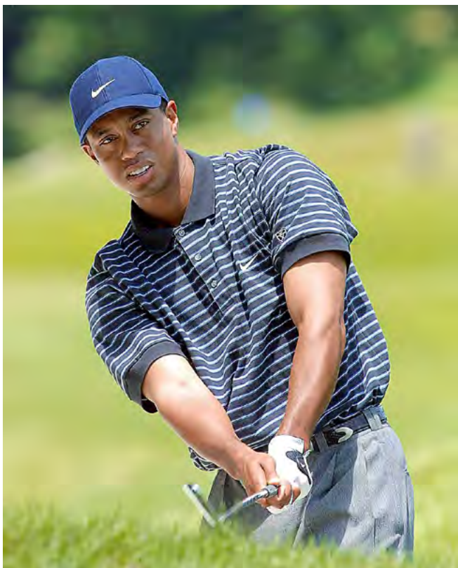
Popiska fotky popiska fotky

Věděli jste, že ze světových hráčů nejdřív zahrál eso Tiger